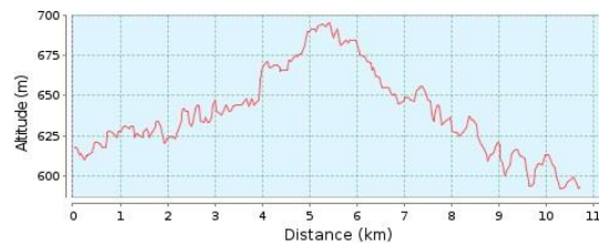
Magasságprofil (592 m - 695 m)

Az útvonal lakott területen kívül, aszfaltozott műúton halad. A táv feléig emelkedik, utána lejt. Szintidő letelte 13:50-kor