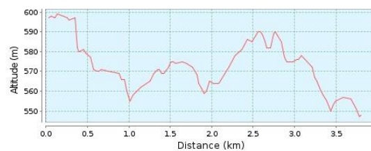
Magasságprofil (547 m - 599 m)